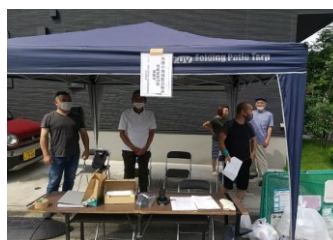
地域防災無線訓練